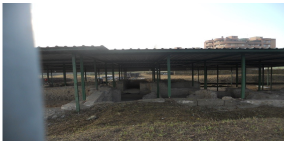
Villa Romana Via Buazzelli