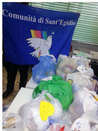
Figura 1 e foto 2 tanti panini e un biglietto per salutare un amico in difficoltà